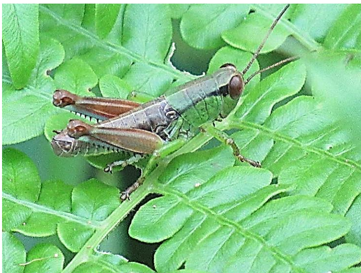
フキバッタ 翅が短くあまり飛べません。 そのため、種分化が多いそうです。