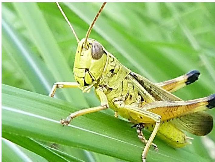
ツマグロバッタ ♂ 黄褐色で鮮やか