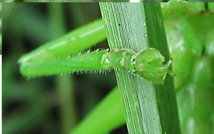
カヤキリ とても大きい。硬いカヤを切る強靱な顎とグローブのような手。