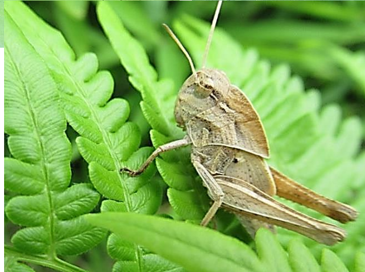
幼虫 鉄の鎧をつけているようです。翅が生えかけています。