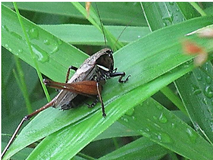
ヒメギス ほとんどの個体は黒っぽくぼってりしています。