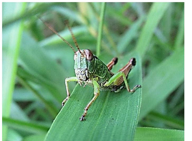
幼虫は仮面ライダーみたいです。