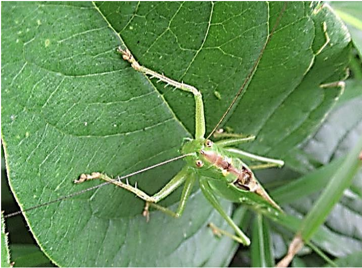
ヤブキリ 目が黄色っぽい。