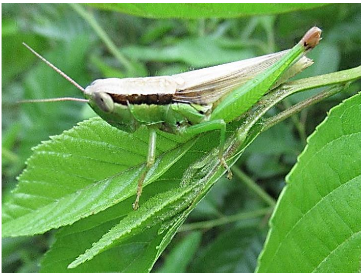
コバネイナゴ 目から黒い筋があります。