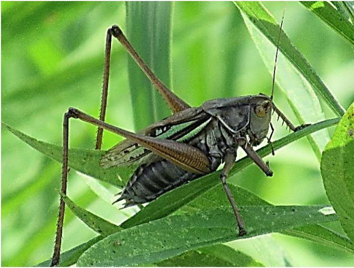
キリギリス 貫禄があります。