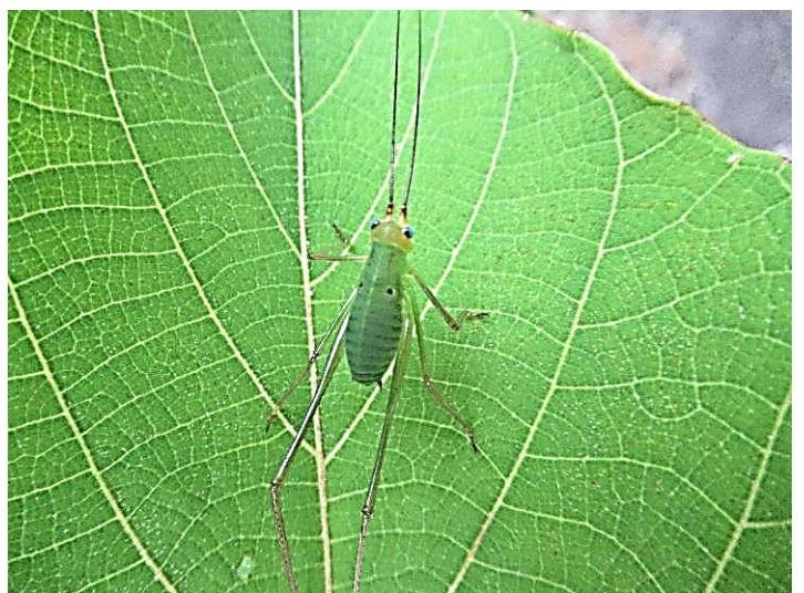
幼虫 目が青く愛らしい。