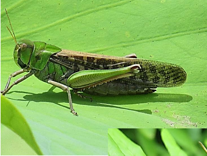
トノサマバッタ 緑型