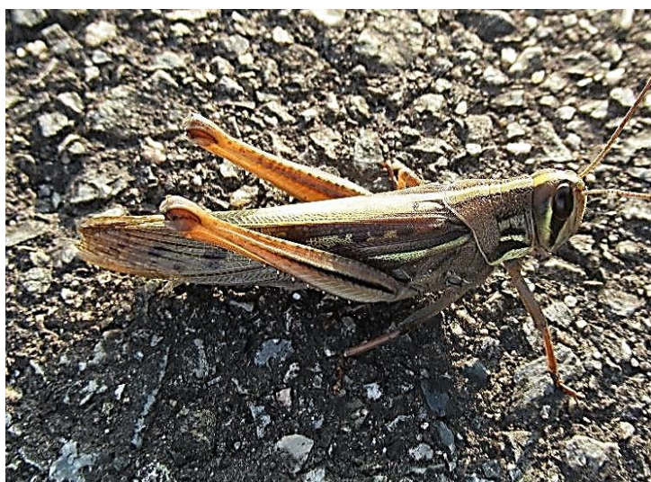
ツチイナゴ 幼虫とは似ても似つかない感じですが、涙目が特徴です。