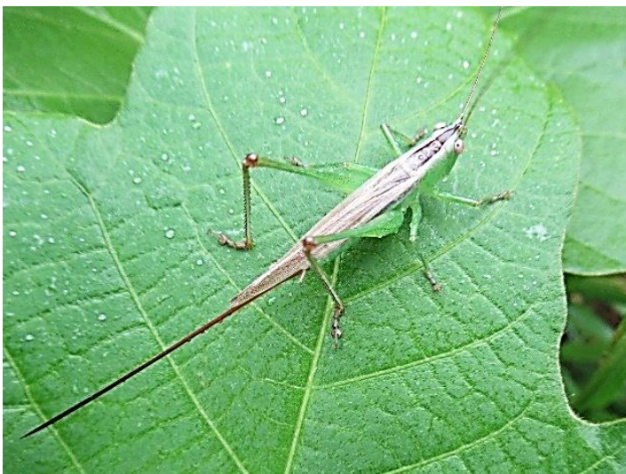
オナガササキリ ♀ 産卵管が目立って長い。