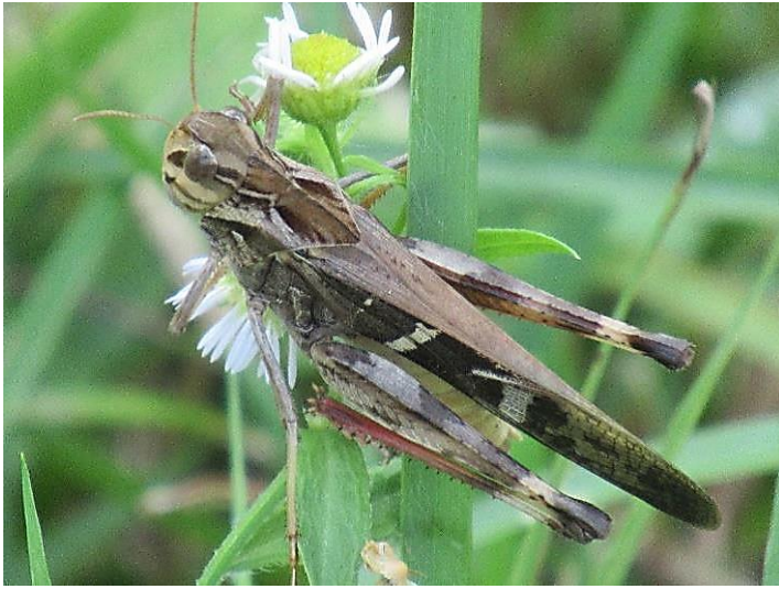
クルマバッタモドキ 首のところに特徴があります。