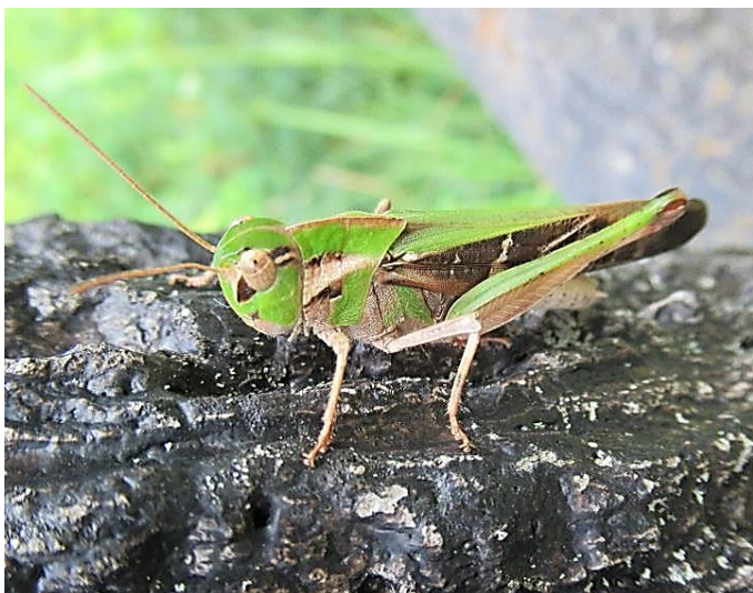
クルマバッタ 跳んでいる時の翅が車輪のように見えます。