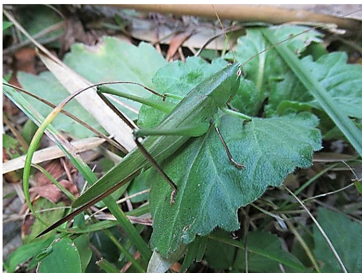
クサキリ ♀ 緑型