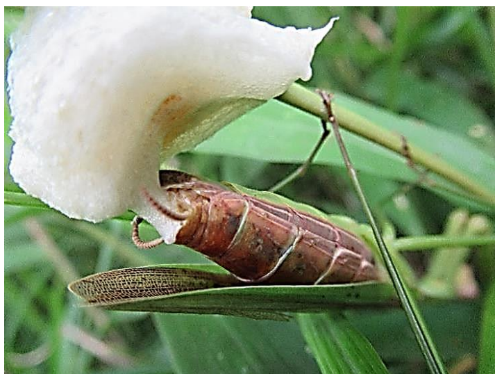
オオカマキリの産卵