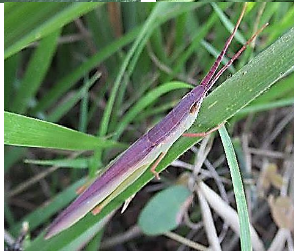
後ろ足の行儀がいいです。