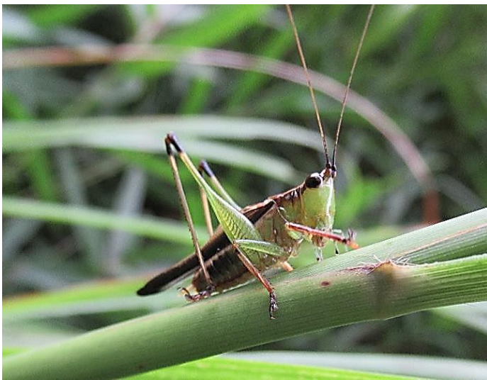
ササキリ 後ろ足の膝が黒っぽい。