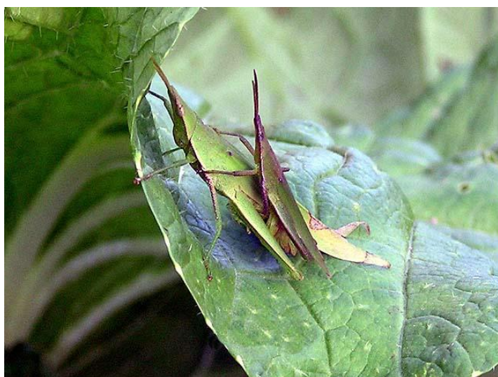
おんぶされているのは ♂ 交尾中