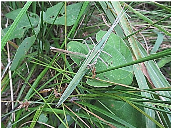
ショウリョウバッタ 緑型