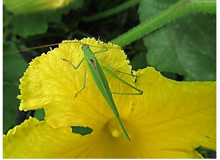
セスジツユムシ 触覚が体長より長く、スリムです。