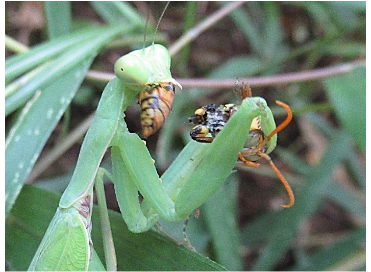
鎌の内側の付け根に数個、黄色い突起があります。 アシナガバチを口いっぱいほおぼっています。