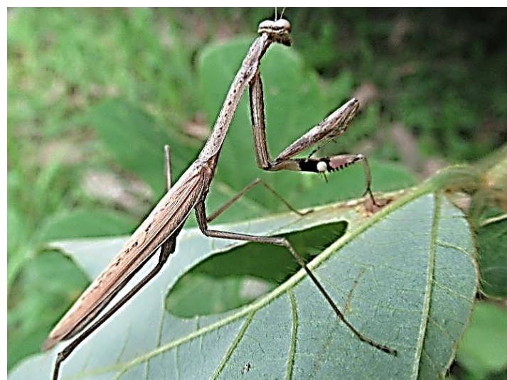
コカマキリ 前足に模様が有ります。