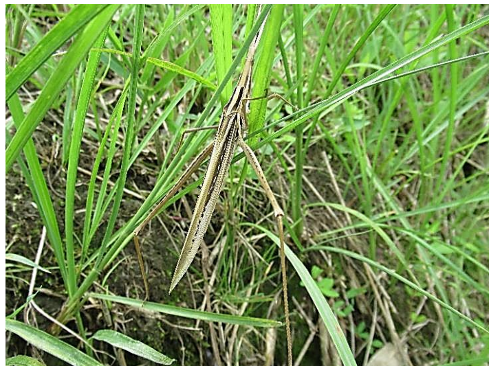
茶色型 とてつもなく後ろ足が長い。