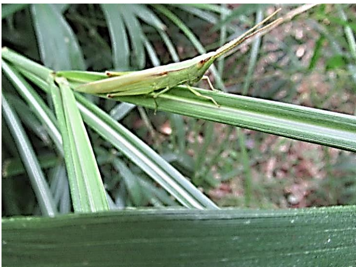
ショウリョウバッタモドキ