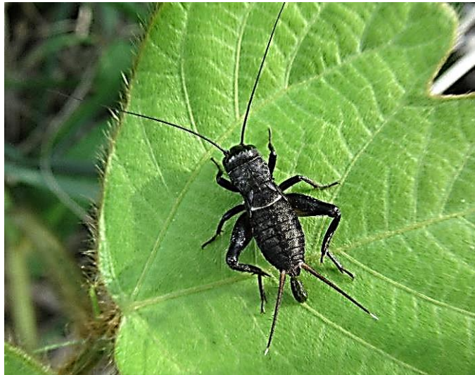
エンマコオロギ 幼虫