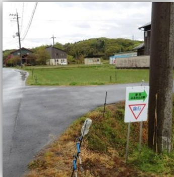
ふるさと公園の正面北の 三叉路(両面)

ふるさと公園に来られる方は、車は徐行していただき、地域住民に迷惑がかからないようお願い致します。