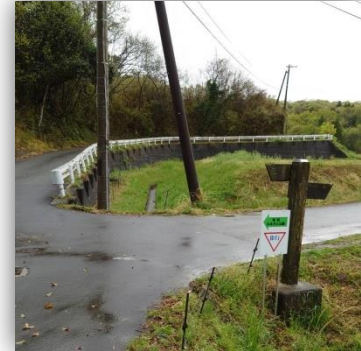
西より村内に進入した最初の 十字路(右に設置)