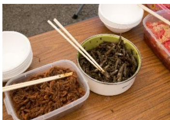
ごはんがすすむ佃煮