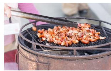
ザリガニの旨さを知りました