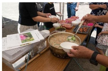
炎天下の冷汁は最高