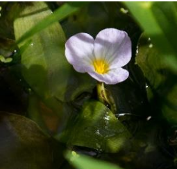
写真左 調査のようす 写真中 オモダカ 写真右 ミズオオバコ

8月26日(土) 市史編さん協力プロジェクト吉川町ため池調査 12:30-17:00 会員5名、水辺ネット2名