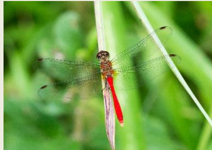
マユタテアカネ(オス)