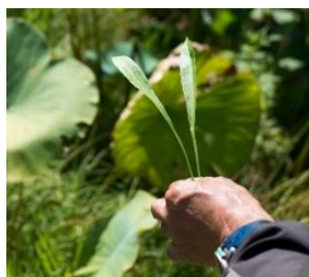
ヘラオモダカを観察