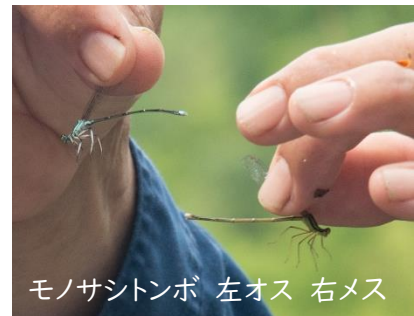
モノサシトンボ 左オス 右メス

お寺の堀に移動し、それぞれ網を入れアメリカザリガニなどを捕獲。この堀にあったヒツジグサはザリガニの食害により見られなくなったなどザリガニの影響について説明を受けました。次に、湧き水「念仏水」の伝説を聞き水路を流れる水を味見。「甘い気がする」と言う人も。下流へ移動しプラナリアを採取した後、川へ移動。網を川に入れ水の生き物を探しました。