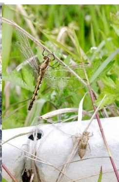
シオカラトンボ 【2026年4月25日】