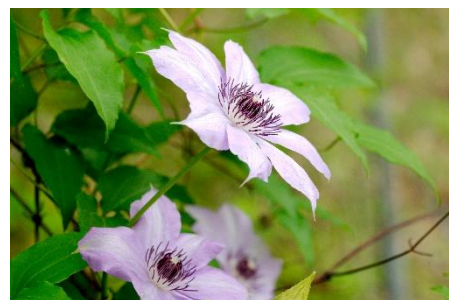
カザグルマ(青)【2026年4月29日】