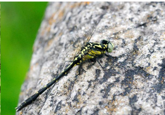
フタスジサナエ 【2026年4月29日】