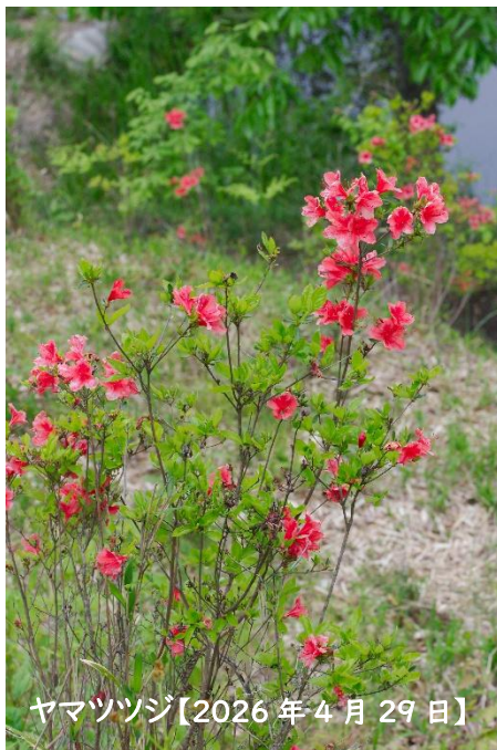
ヤマツツジ【2026年4月29日】