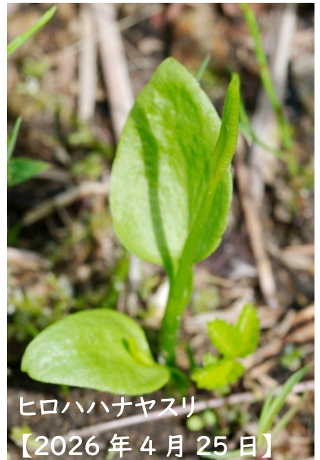
ヒロハハナヤスリ 【2026年4月25日】