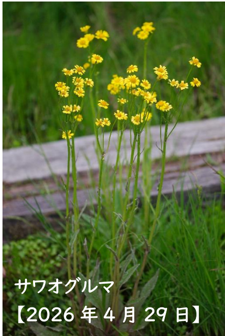
サワオグルマ 【2026年4月29日】

「目に青葉、山ホトトギス、初経」(山口素堂)の季節。八十八夜が過ぎ、ふるさと公園の周りでは農作業が始まり、公園内の多くの生き物の活動も始まりました。【 】内は撮影日です。