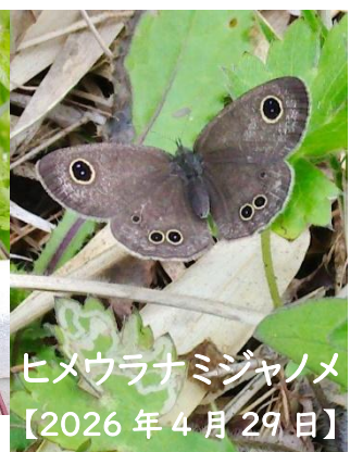
ヒメウラナミジャノメ 【2026年4月29日】