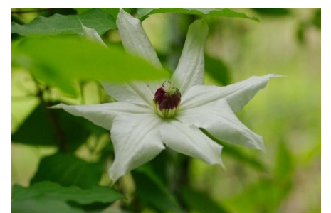
カザグルマ(白)【2026年4月29日】