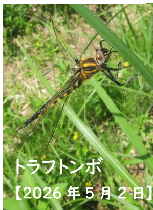
トラフトンボ 【2026年5月2日】