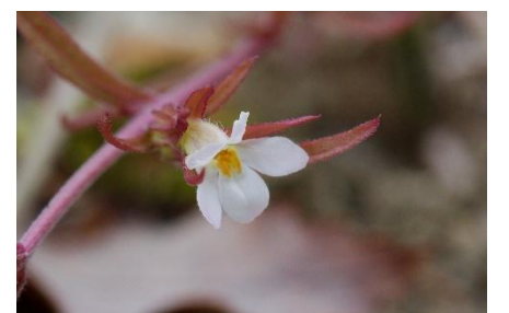
クチナシグサ【2026年4月13日】